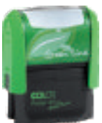
Printer plus 20 Green Line