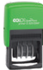
S220 Green Line (1 hónap múlva rendelhető)