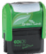
Printer plus 30 Green Line