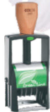
Classic 2360 Green Line (1 hónap múlva rendelhető)

Az újrahasznosított alapanyagból készült termékek előállítási költsége magasabb, mint a hagyományos termékeké. Az ebből fakadó különbséget azonban a környezetvédelem érdekében az R+C Zrt. átvállalja, így a Green Line termékek a velük megegyező méretű hagyományos bélyegzők árán vásárolhatók meg.