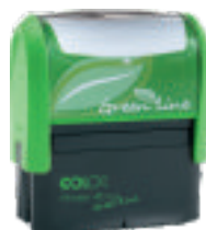
Printer plus 40 Green Line