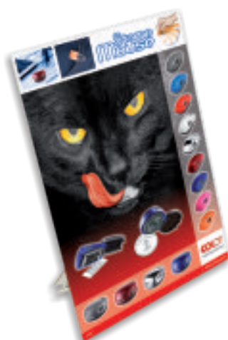
Karton display: A4