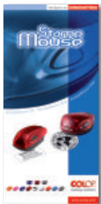
Stamp Mouse prospektus: LA4