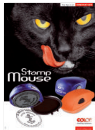
Stamp Mouse poszter: A2